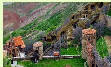
Besichtigungswanderungen Wegekategorie: leicht ●●● Aufstieg: zwischen 300 m

Transfer zum Tiflis oder Kutaisi internationalen Flughafen Abreisen