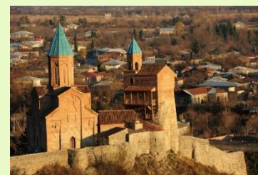
Besichtigungswanderungen Wegekategorie: leicht ●●● Aufstieg: zwischen 300 m